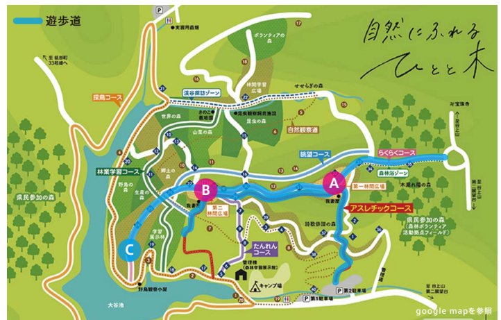
A 第一林間広場 B 第二林間広場 C 遊歩道

発表場所の詳細情報(写真など)は 下記URLよりご確認ください ※随時更新中 https://x.gd/290ll