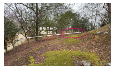
..... Bの設置型作品・パフォーマンス等候補場所